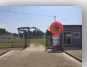
受付入口 (カフェショップ横)