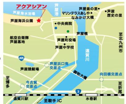
●遠賀川駅行きバス停 ●折尾駅行きバス停