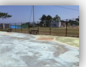
会場B (トイレ、更衣室、シャワールーム)